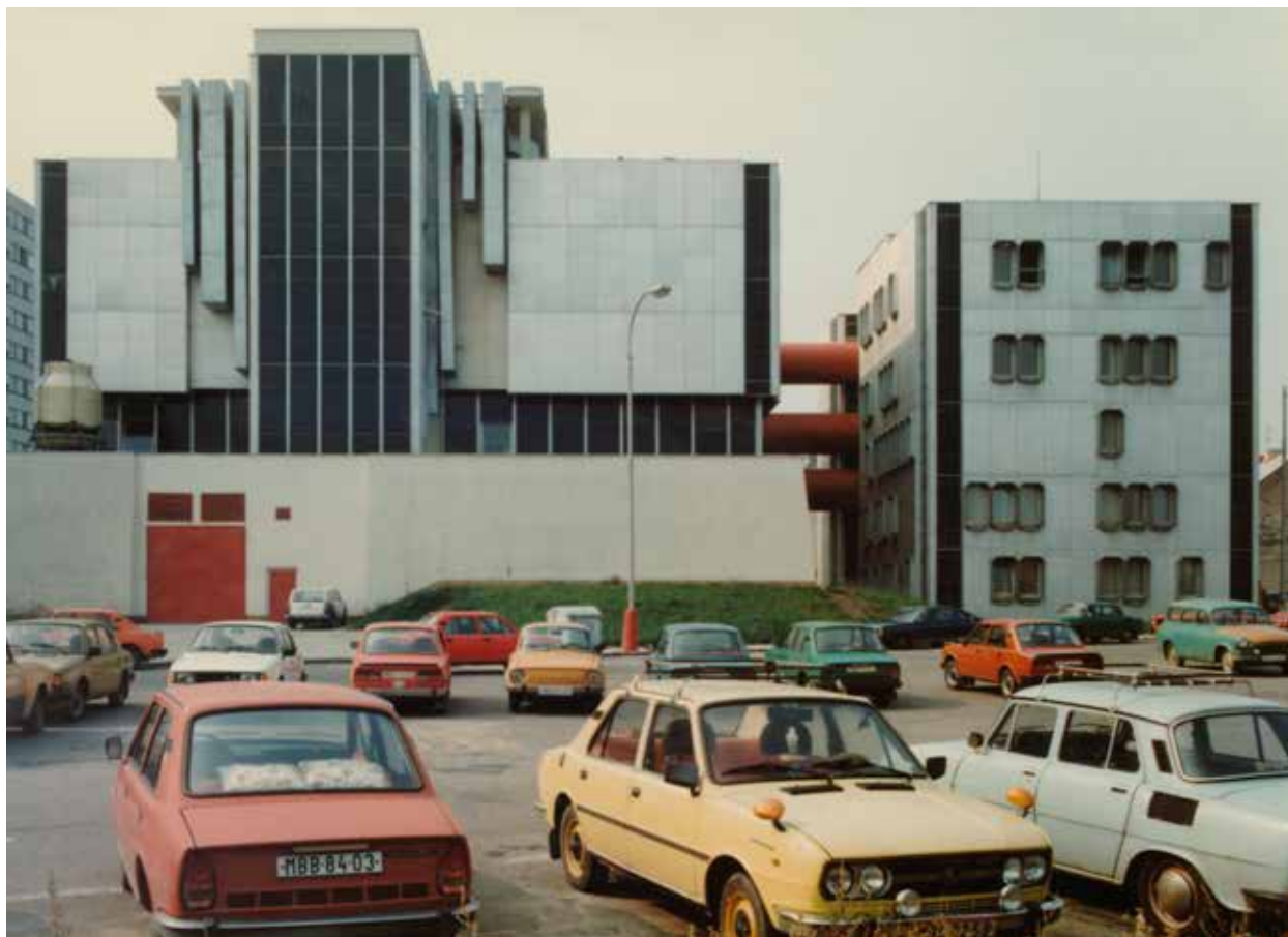
Telekomunikační budova v Mladé Boleslavi (1975–1984), Jiří Eisenreich, Jindřich Malátek, Ivo Loos, Václav Aulický, Jan Fišer, Spojprojekt Praha