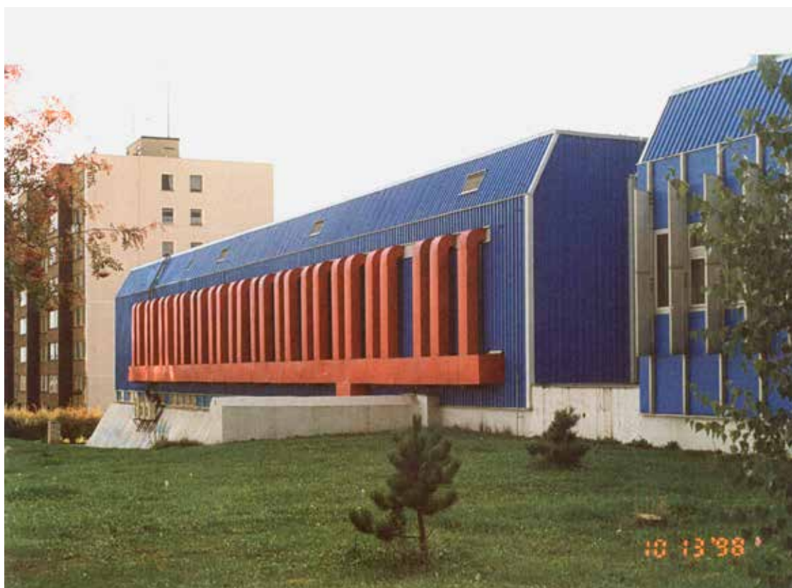
Automatická telefonní ústředna Praha Bílá Hora (1979–1984), Václav Aulický, Spojprojekt Praha