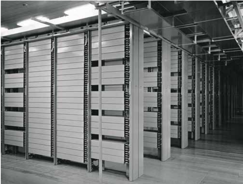
Mezinárodní ústředna třetí generace AKE-13 od firmy LM Ericsson v Ústřední telekomunikační budově v Praze, foto: Marie Bonaventurová, 1985, Sbirka Poštovního muzea